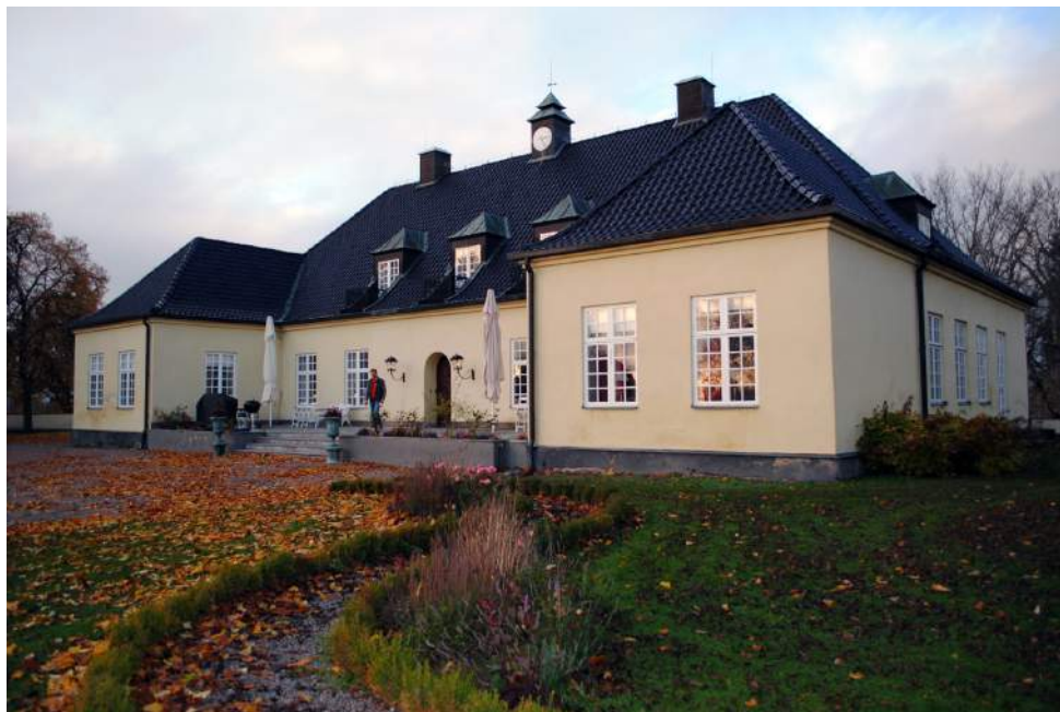
Huvudbyggnaden på Idingstad uppfördes 1737 men en stor renovering genomfördes av en tidigare ägare på 1960-talet.