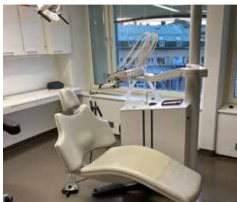
Ett av klinikens fina behandlingsrum.

Vi lagar ju och rotfyller och allt sådant också och så har vi även specialistbiten.