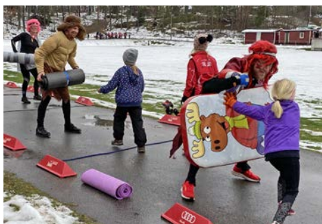
En klassiker är att ta sig förbi gladiatorer.