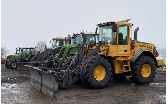
En del av maskinparken.

Om man kan använda ett ord som högsäsong i det här sammanhanget så varar den från mars till oktober. Däremellan är behovet av personal betydligt lägre.