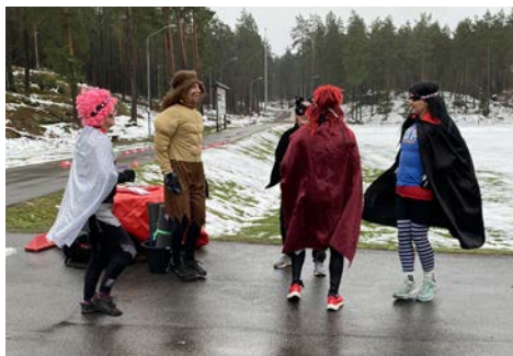
Skidkulsgladiatorerna laddar upp inför utmaningarna.

I väntan på snöbelagda skidspår så ser Skidsektionen till att hålla igång ändå och ha kul. □