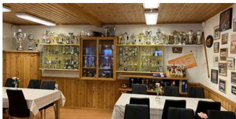
Pokaler och annat i klubbstugan, men allt är inte Skidsektionens troféer.